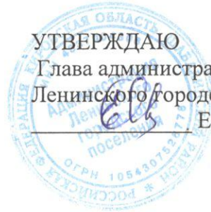
Схема размещения торговых мест на ярмарке

Глава администрации Ленинского городского поселения Е.В. Огаркова